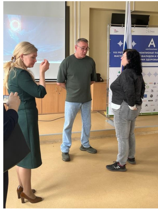
Встреча учащихся и родителей с участником СВО.