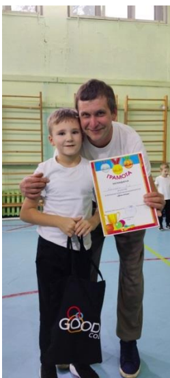
Школьный спортивный праздник «Весёлые старты», ко Дню Отца