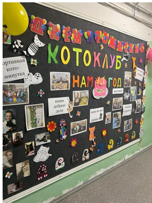
Выставки творческих работ учащихся, сделанные совместно с родителями.